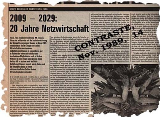
Panorama de la economía de trueque del año 2029 de S. Flor.