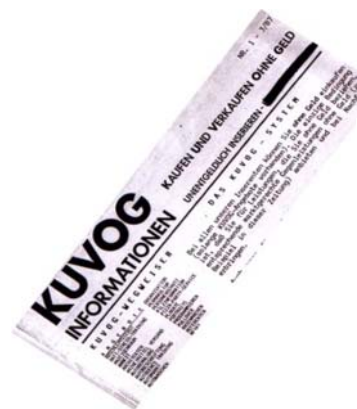
KUVOG (Compre y venda sin dinero), una iniciativa originada en Hannover en 1987 que nunca llegó a concretarse.

A fines de los setenta y comienzos de los ochenta, la gente redescubrió esta economía informal. Tareas del hogar y trabajos del tipo "hágalo usted mismo", junto con el pluriempleo y la nueva generación de trabajadores independientes que trabajaban en cooperativas recientemente establecidas. Muchas de las ideas analizadas en aquel momento sirvieron de base para el desarrollo de algunos sistemas de intercambio.